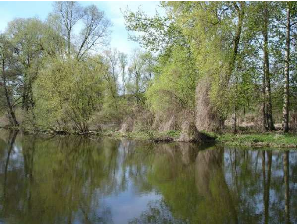
Auf dem Havelkanal nach Ketzin

Wir fahren, über Schleuse Schönwalde, auf dem Havelkanal. Unsere erste Übernachtung in Brieselang verlief fast problemlos. Der Stegwart musste allerdings per Handy herbeigerufen werden, um uns Gelände und Sanitäreanlagen zu öffnen.