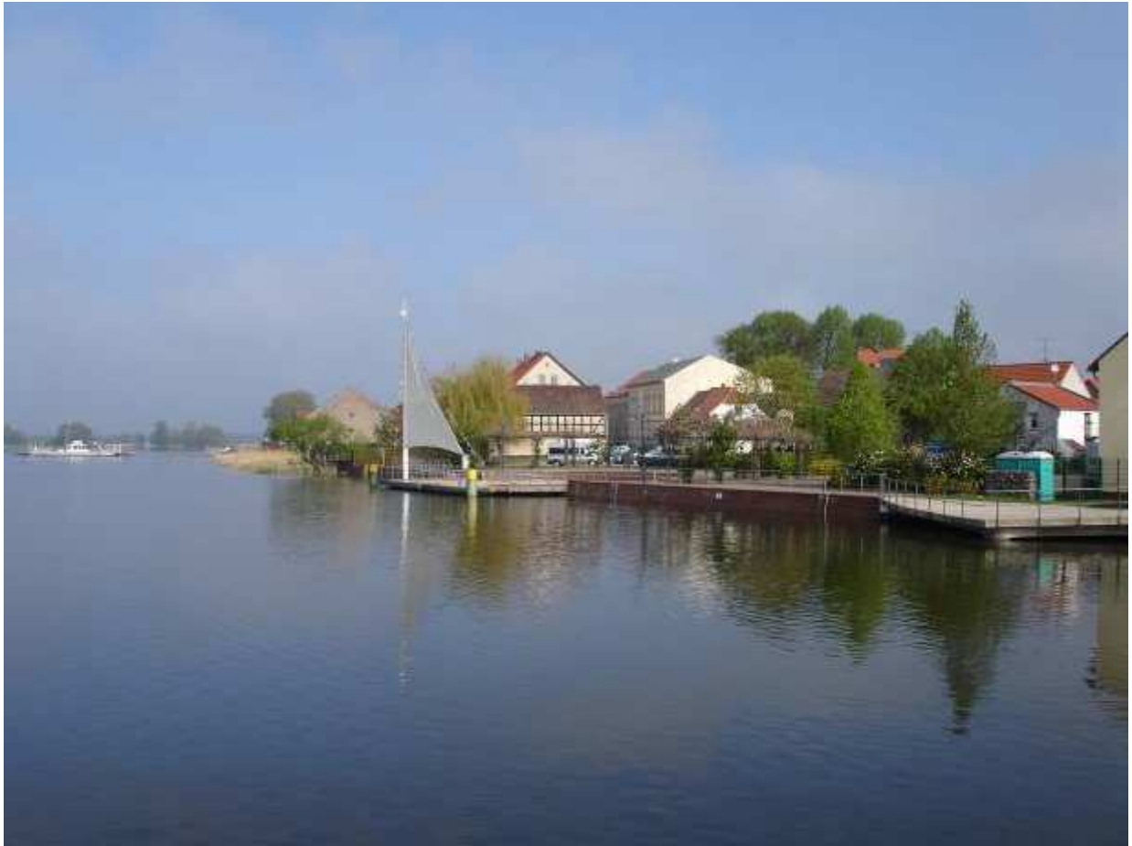
Pritzerbe - im Hintergrund die Fähre, welche Pritzerbe mit dem Ortsteil Kützkow verbindet