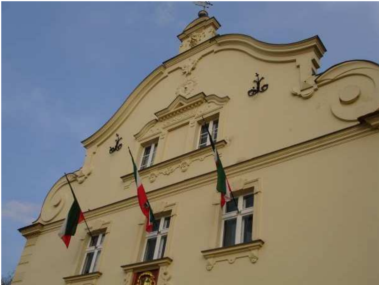
Werder, altes Rathaus

Kurz vor Werder, unserem letzten Hafen. In Werder mischten wir uns unter die Besucher des Baumblütenfestes. Eindrucksvolle und wohl ewig gültige Bilder über die „lustigen Umstände“ dieses Volksfestes lieferte schon der alte Zille. Es hat sich nicht viel geändert... der in den Gärten zur Verkostung gereichte Obstwein ist in Maßen und mit Vorsicht zu genießen!