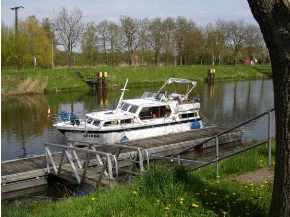
Die BELUGA vor der Schleuse Parey

Der Wasserstand auf der Elbe war unbedenklich, trotzdem navigierten wir nach den am Ufer gelegenen Markierungen für eine sichere Passage des Flusses. So kreuzten wir im Zick-Zack-Kurs die Elbe abwärts Richtung Tangermünde. Die Strömung verlieh uns jetzt ein ordentliches Tempo